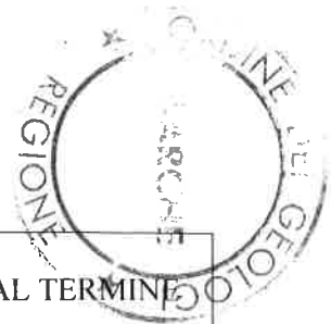
TABELLA DIMOSTRATIVA DELL'AVANZO DI AMMINISTRAZIONE PRESUNTO AL TERMINE DELL'ESERCIZIO 2020